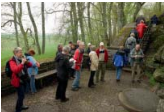
Besöker S:t Sigfrids källa invid Husaby kyrka