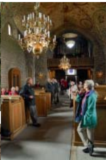
Lyssnar andaktsfullt på den inspelade guidningen i Husaby kyrka