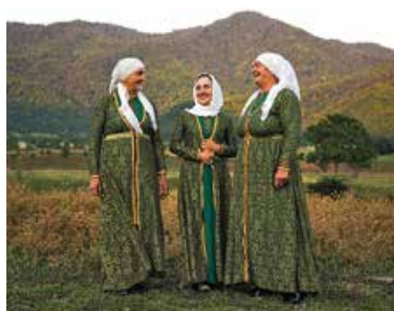
En kvinnlig sångensemble framför kistfolkets traditionella musik.

Måltider som ingår i resans pris inom parentes. F = frukost, L = lunch,