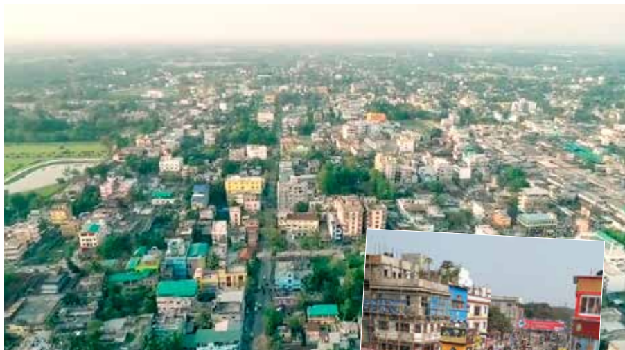
Cooch Behar.

mit med nya krav rörande arbetarnas situation och dessutom höjt skatterna så att det nu var en förlustaffär. Hon kommenterade att regeringar är underliga lite varstans.