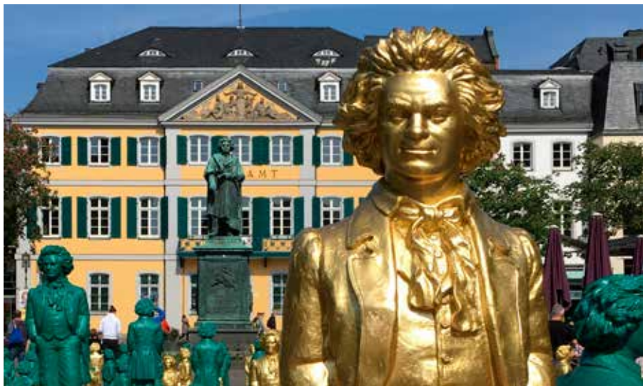
Ludwig van Beethoven föddes 1770 i Bonn och på Münsterplatz står han staty.

men för våra föredrag. Som vanligt kommer resan att bjuda på umgänge under trevliga former samtidigt som vi får förstklassiga upplevelser, nya kunskaper och spännande inblickar!