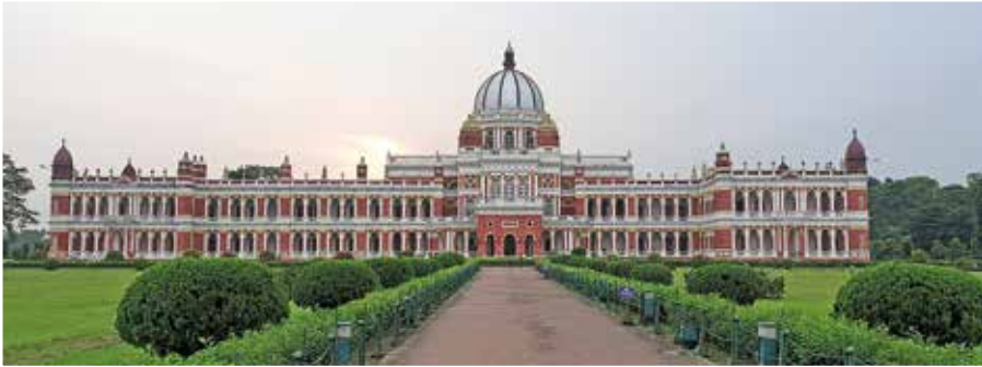
Palatset i Cooch Behar.

net. När en ko dog lades hela kroppen i Ganges. Resan gick sedan till Delhi där hon bodde hos engelska baptister, som hade stor skolverksamhet i Delhi. Hon turistade och beundrade gamla byggnader från 1500-talet. Hon besökte världens näst största moské och fick se en hårlock och en sko som sades ha tillhört Muhammed. Dessa relikier plockades fram för besökarna. Hon betalade ½ rupie för besväret, men fick veta att något så dyrbart visade man inte för mindre än 1 rupie. Molly svarade att hon inte tyckte att det var värt mer än ½ rupie. ”Så ni hör att jag kan morska upp mig”, skrev hon i brevet. Hon skrev också att hon lärt sig att förhärda sig mot riksha-männens bedjande blickar, när de ville ha mer betalt. Hon visste att de ändå fick mer av henne än de skulle ha fått av en indier.