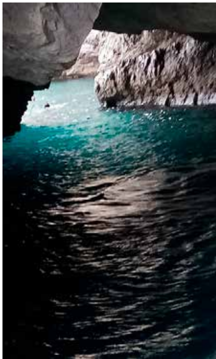
Blå grottan Capri

Det lutande tornet hade jag ju sett på bild otaliga gånger. Men ändå var verklighetens torn överraskande. Förvisso lutande, som mest 4,5 m. Men så rikt utsirat! Och alls inte ensamt i sin prakt. Intill låg en praktfull katedral med si-