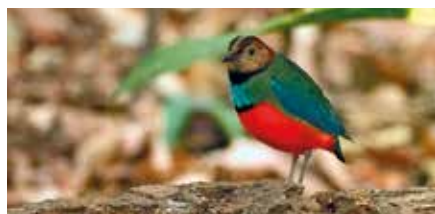
Sulawesijeweltrast.

inte återfinns på Sulawesi. Faunan här har allt större inslag av australisk fauna med bland annat klättermungdjuret moluckkuskus, vittofskakadua, 15 arter kungsfiskare, samt den spektakulära vimpelvingade paradisfågeln (Standardwing), vars spelplats vi besöker. Det var florans och faunan på Halmahera som var Sir Alfred Russel Wallace huvudsakliga inspirationskälla när han utvecklade sin teori om arternas ursprung.