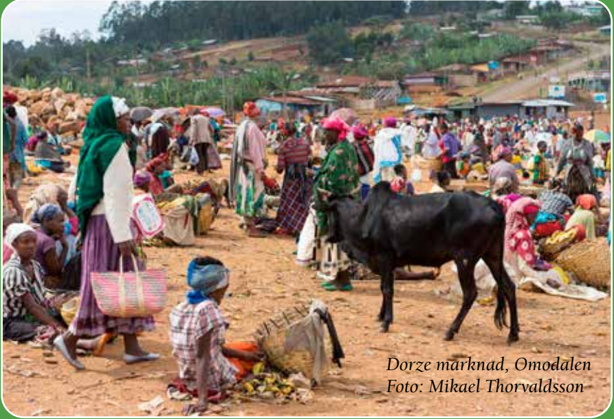
Dorze marknad, Omodalen