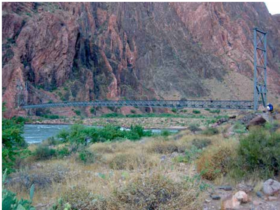
Bron över Coloradofloden

Vår vandring startade på norra kanten på en höjd av 2500 m. Vi kom iväg mitt på dagen och följde the Kaibab trail i en sidocanyon. Till att börja med gick vi i skog som blev allt lägre och glesare allt eftersom vi gick nedför. Det var ansträngande för knäna och mycket varmt där vi gick rakt söderut. Vi hade fantastiska vyer över det spännande