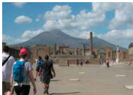
Pompeji och Vesuvius