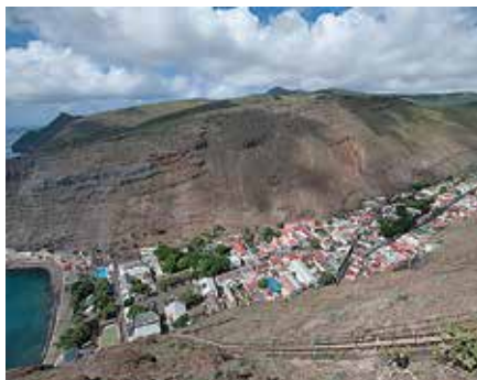
Tristan da Cunha, världens ensligaste belägna samhälle

Vårt fartyg m/v Plancius går med passagerare i Arktis och Antarktis. Hon har viss isklass och tar 116 gäster, är 89 m lång och 14,5 m bred med en marschfart på 10,5 knop. Varje hytt har dusch och toalett. Mat- och föreläsningssalen är rymlig och Observation Deck har panoramavy föröver och bar. Även goda däcksutrymmen kommer väl till pass då vi når varmare breddgrader efter Tristan. 10 zodiacs gör landstigningar effektiva. Hon har en internationell besättning på 47 personer, varav åtta är guider/ledare/föredragshållare under ledning av en holländsk Expedition Leader. Ombord finns också en läkare.