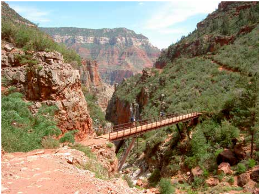
En sidocanyon på den norra sidan

av det gemensamma medan det mesta bars av vår trevliga guide Ryanne. Hennes ryggsäck vägde drygt 30 kg och våra betydligt mindre.