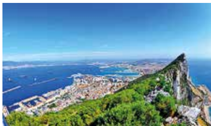
Vi besöker de två spännande exklaverna Gibraltar och Ceuta.

intressanta städer, Jerez de la Frontera och Cádiz. Till Jerez vallfärdar såväl hästtokiga som vinkännare från hela världen, tack vare den kungliga andalusiska ryttarskolan och stadens sherrybodegor. Vi gör en stadsrundtur och provsmakar sherry. Kuststaden Cádiz som är västlandets äldsta stad har en välbevarad stadsmur, livfull hamn och innanför den ligger små gränder och låga hus. Den moderna delen av staden ligger vid playan.