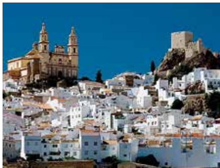
Cádiz är västlandets äldsta stad.

Cádiz och Jerez de la Frontera. På väg från Sevilla till Gibraltar besöker vi två