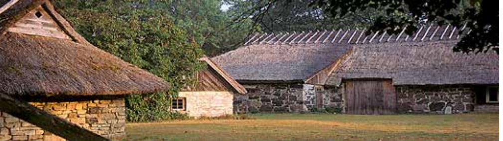
På ön Muhu - byn Koguva - där vi skall bo