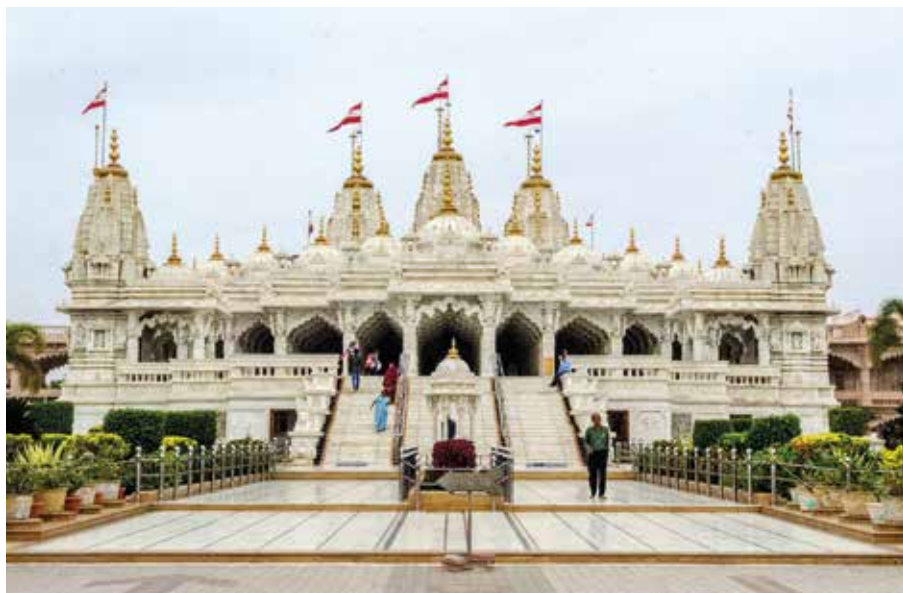
Shree Swaminarayan Bhuj

Text: Karin Malmgren Bild: Ulla-Britt Ericsson