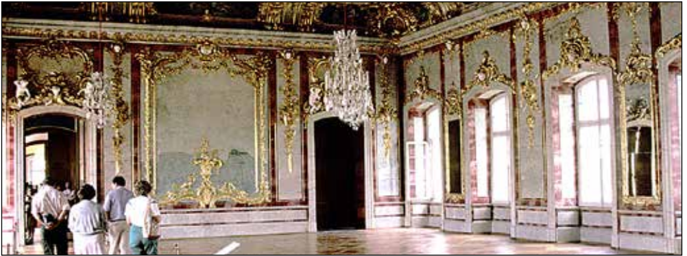
Rundale, ritat av Rastelli - som också ritade ritade Vinterpalatset i St Petersburg

Adelspalats och gamla bondbyar, svenska befästningar, ryska kloster, förtrollande skulpturparker och ryska ikoner, folkkonst, otroliga människoöden, frivilliga hjälporganisationer, välbevarad natur, vandrande sanddyner. Tallinn, Tartu, Riga, Vilnius. God mat trevligt serverad med härligt öl! Guide: författaren Pär Lindström.