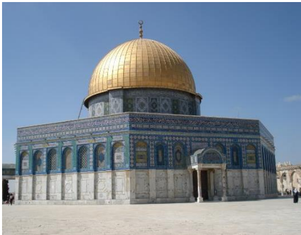
Klippsdomen på tempelplatsen

mot Betlehem och vi får räkna med att det tar en liten stund att passera gränsövergången eller checkpointen som den kallas. Man förstår att det är besvärligt för de Palestinier som arbetar i Jerusalem och måste passera gränsövergången varje dag. Vi checkar in på vårt centralt belägna hotell och avnjuter sedan en gemensam middag. (Frukost, lunch och middag ingår)