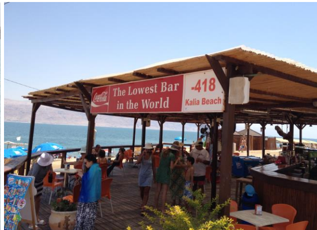
Här hittat vi också världens lägst belägna bar