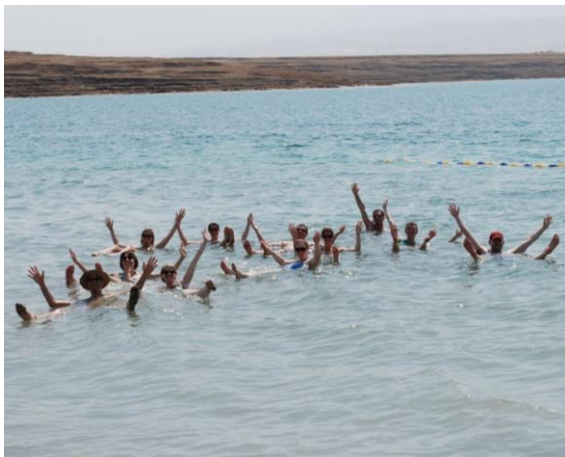
I Döda Havet flyter man som en kork