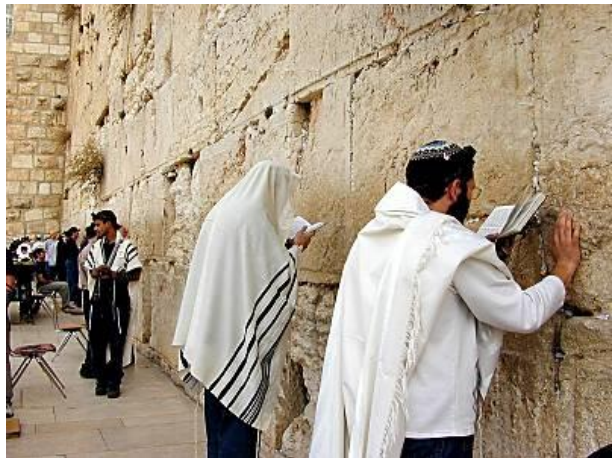
Västra muren - Klagomuren