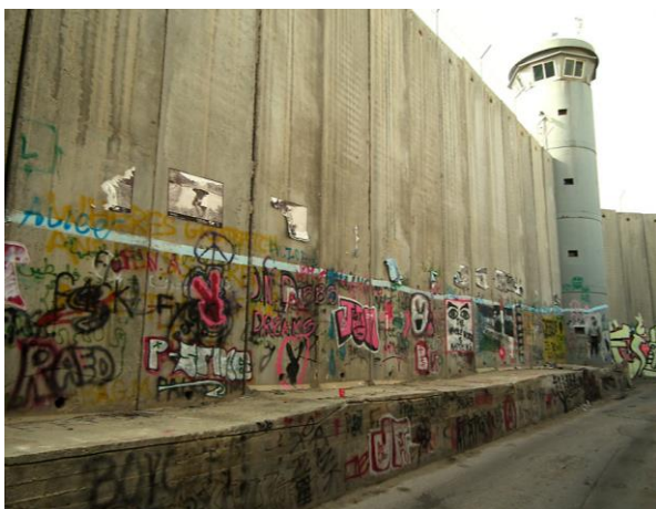
Den höga muren är fylld med graffiti

Nu är det dags att bekanta sig lite närmre med den stad som har så stor betydelse för många människor oavsett religiös tillhörighet och trosuppfattning. Här blandas böneutropen från minareterna med kyrkklockornas ringande och mängder med pilgrimer från hela världen vallfärdar till staden varje år. Vi besöker den berömda Födelsekyrkan, som så sent som 2012 fick en omdiskuterad plats på Världsarvslistan. Lunch på en traditionell Palestinsk Falafelrestaurang och därefter går vi för att se den höga och långa muren som isolerar de Palestinska områdena från Israel. Barriären mellan länderna har stora konsekvenser för människorna i båda länderna och muren är täckt med graffiti konst med olika budskap. Nu väntar ett spännande besök! Vi ska besöka en svensk skola för Palestinska barn med skriv- och lässvårigheter. SIRA, Swedish International Relief Association, har sedan slutet av 60-talet bedrivit hjälparbete bland barn på Västbanken. Skolan är öppen för alla barn med särskilda behov oavsett religionstillhörighet och samhällsgrupp. Lärarna är Palestinska och all undervisning sker på arabiska. Barnen på skolan tycker därför att det är extra kul när svenskar kommer på besök. (Frukost och lunch ingår)