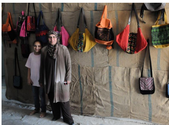
Idna kvinnorna är mycket stolta över sitt arbete