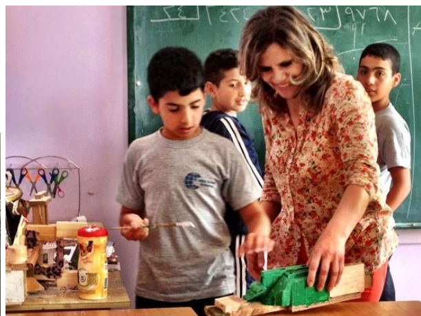
SIRA skolan i Betlehem