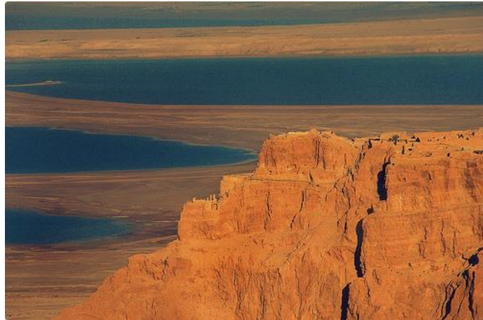
Utsikten från Masada är milsvid