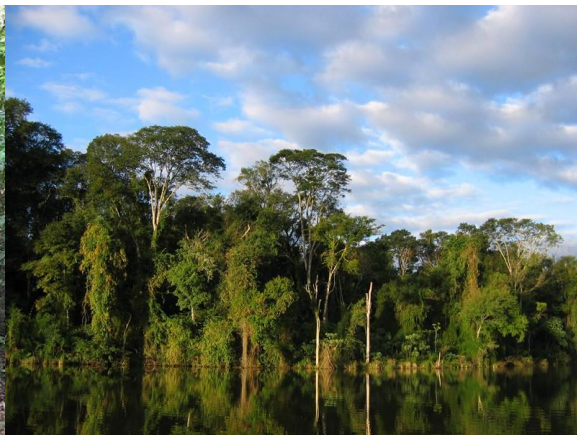
San Rafael nationalpark och atlantisk regnskog