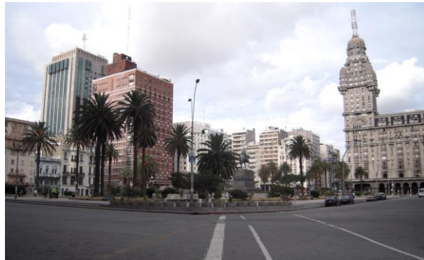
Frihetstorget i Montevideo