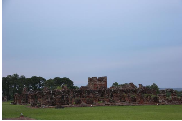
La Santísima Trinidad de Paraná