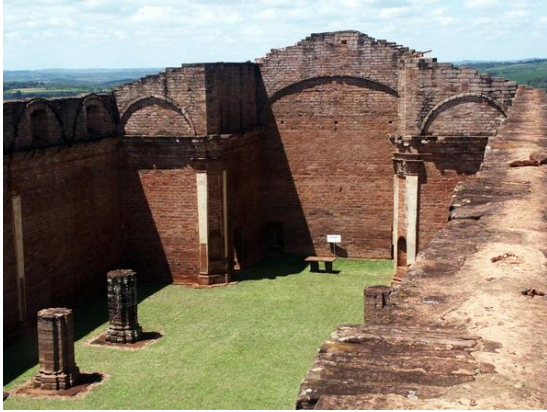
Jesús de Tavarangue

kalkonsläktningen gulnäbbad hocko, svarta vrålapor och marsvinsläktningen Azara's Agouti. När solen gått ner visar sig förhoppningsvis lievingad nattskärna och om vi har riktigt tur kan vi få se strimmig hornuggla.