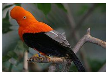
Guiana Cock of the Rock, hane