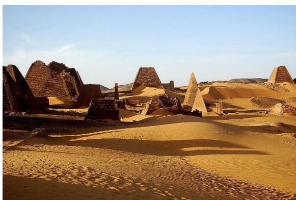
Meroe, ett av UNESCO:s världsarv.