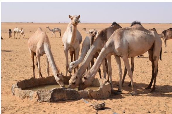
Kameljord vid vattenbrunn.