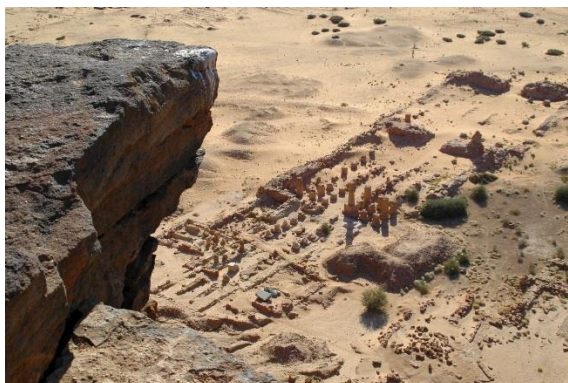
Vy över Amontemplet, Jebel Barkal.