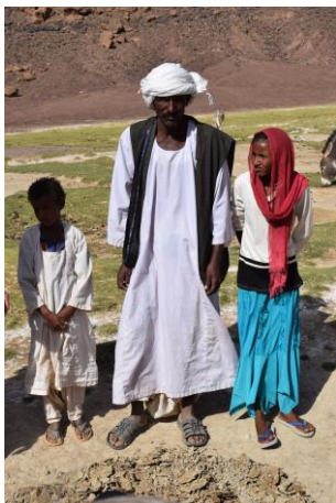
Nomader som vid Atrun-kratern där de utvinnet salt.