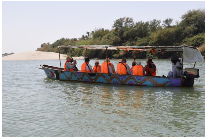
Med båt på Nilen vid 4:e katarakten.