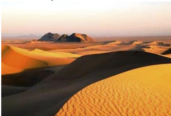
Vår färd bjuder på vidunderliga vyer.