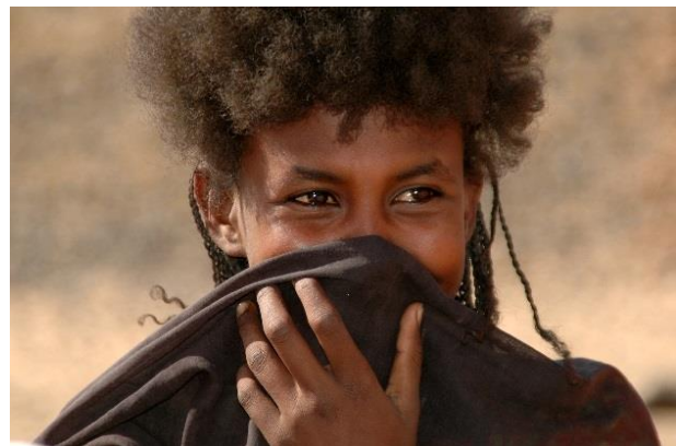
Några av många spännande möten längs vägen