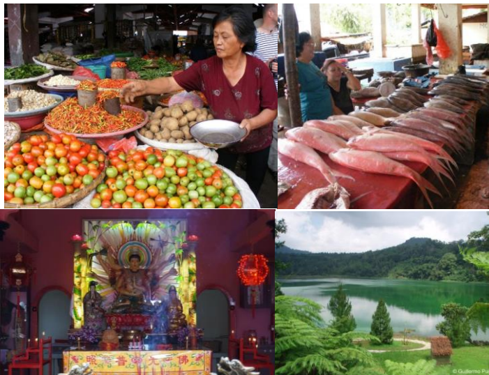
Översta raden: Vi besöker marknaden i Tomohon – här säljs allt som byborna kan behöva och den känsliga bör undvika köttavdelningen! Nedersta raden: I ett buddhisttempel. Den vackra Linowsjön.

Här är lite svalare då vi är på cirka 650 meters höjd över havet– topparna lämnar vi åt andra att bestiga! Området är bördigt och förser Manado med en stor del av de grönsaker stadsborna behöver. Vi bor bekvämt två nätter på hotell. (frukost, lunch och middag ingår)