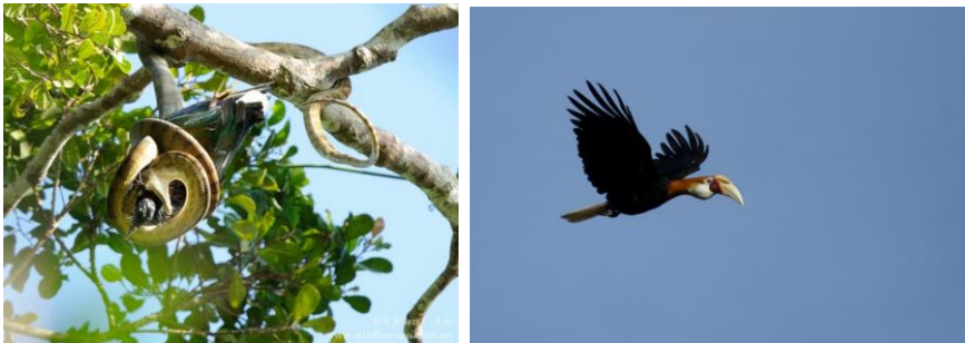
Fler unika arter som vi spanar efter är Halmahera pythonorm och Papuanäshornsfågel.