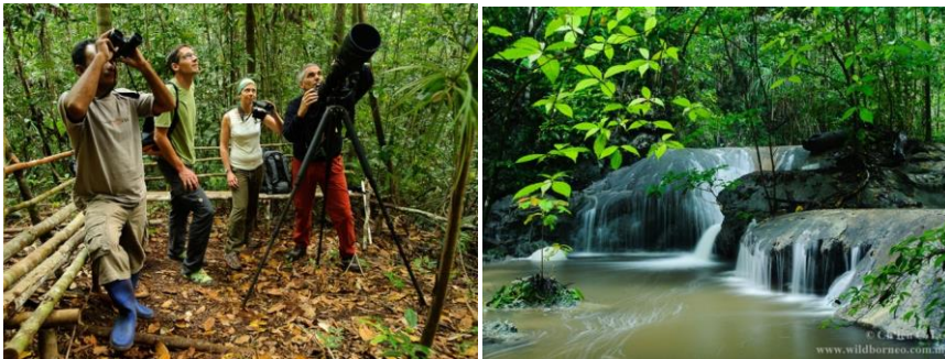
På span efter paradisfåglar vid Weda.