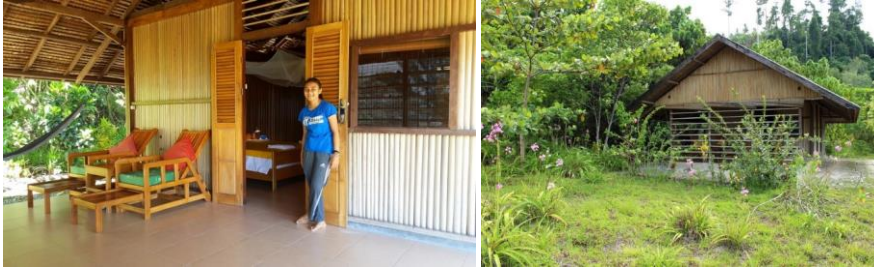
Vi bor bekvämt på den fina ekolodgen Weda Resort.