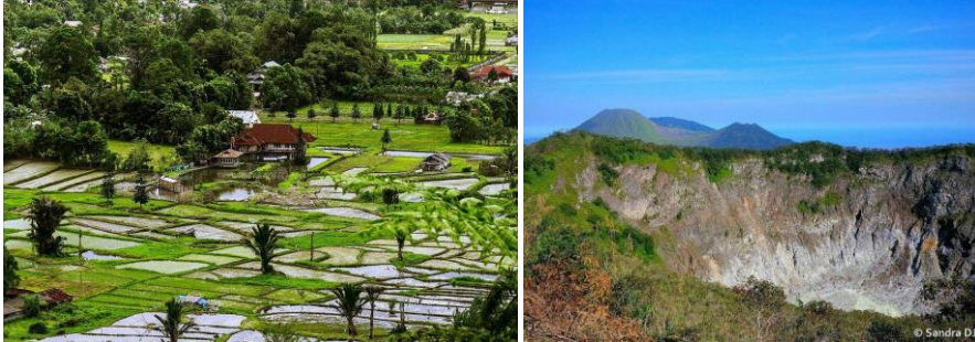
T. v: Minahasa är ett mycket bördigt område. T. h: Utsikt från Mahawu vulkanen, varifrån vi har en magnifik utsikt över havet, Manado och kan se rakt ner i kratern med en smaragdgrön sjö.