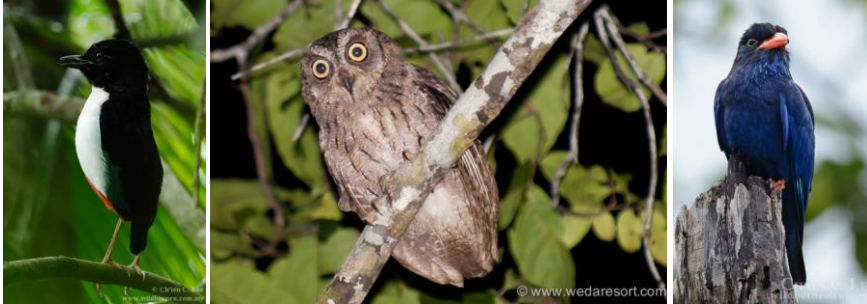
Unika arter som vi hoppas få se på Kryddöarna är (uppifrån och ned) Papuanäshornsfågel (Blyth's Hornbill), Gråhuvad fruktduva (Grey-headed Fruit Dove), Halmaherajuvelftrast (Ivory-breasted Pitta), Moluckdvärguv (Moluccan Scops Owl), Halmaherablåkråka (Azure Dollarbird).