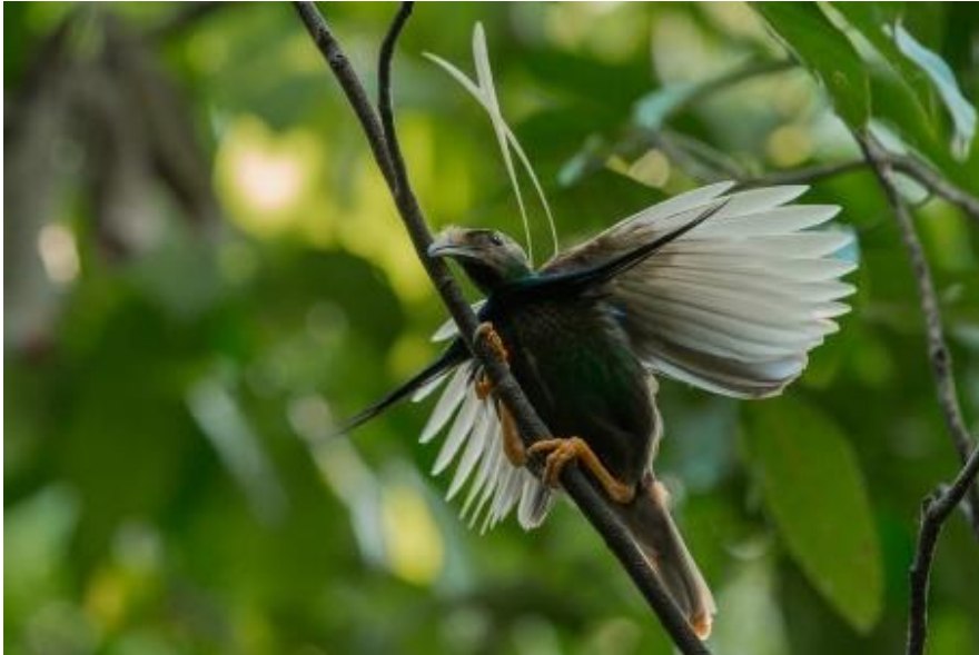
På Halmahera spanar vi efter den vimpelvingade paradisfågeln (Standardwing).