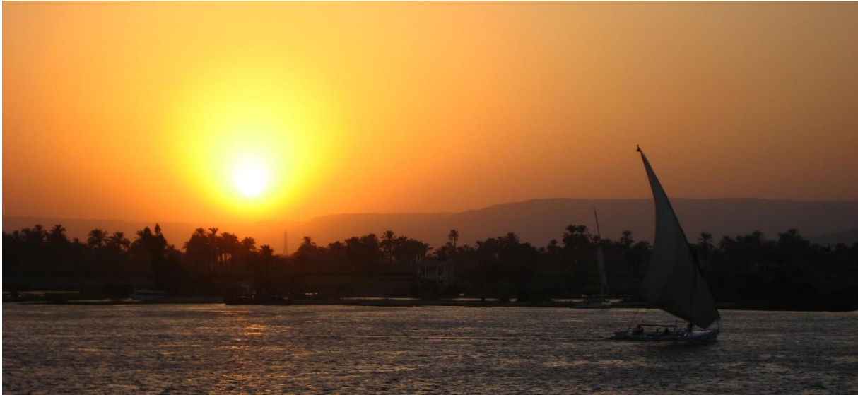
Solnedgång vid Nilen i Luxor