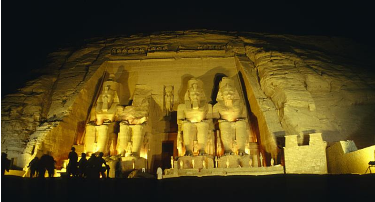
Ljus och ljudshow i Abu Simbel