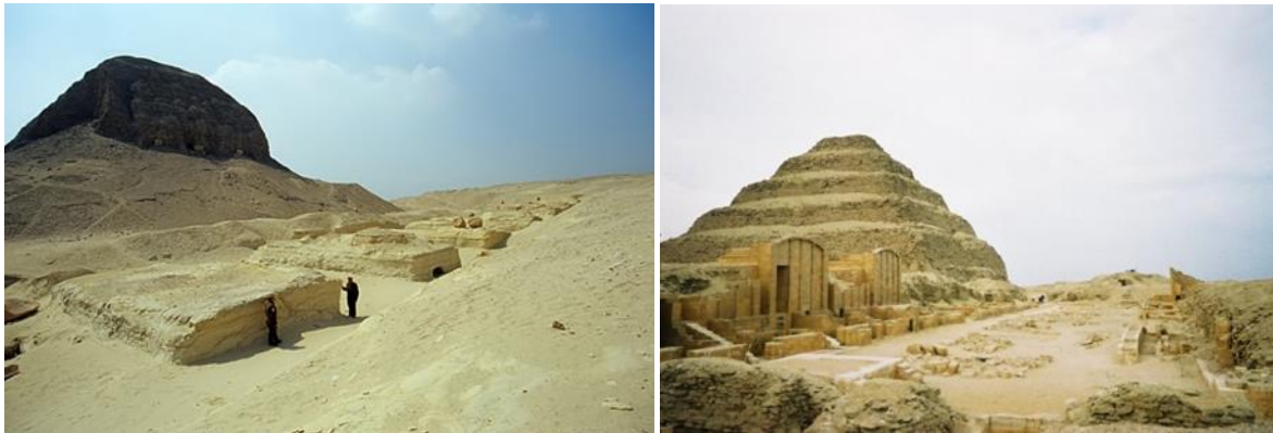
T. v. Pyramiden i El-Lahun som vi också får gå in i. T. h. Farao Djoser trappstegspyramid som uppges vara världens äldsta bevarade monumentala konstruktion i sten.