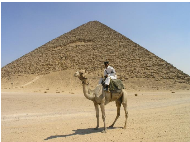
Den röda pyramiden i Dashur