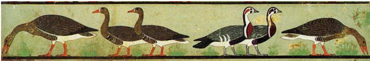
Utsmyckning från Itets grav i Meidum. Numera återfinns den på Kairos museum.

Dahshur , 3 mil söder om Kairo, ligger längst söderut i det område som Unesco utsett till världsarv. Här finner man sju större pyramider, liksom flera ämbetsmannagravar. Två av de yngre pyramiderna har förstörts av tidens tand, medan andra, som den Svarta pyramiden, uppvisar en starkt eroderad om än mäktig kärna i obränt tegel. Men detta är också platsen för två av Egyptens bäst bevarade pyramider ända från 2600 f. Kr. Det är den Röda pyramiden och den Böjda pyramiden, vilka båda sedan 2019 är öppna för besökare. De uppfördes av kung Snofru, fadern till den kanske mer kände Cheops. I den Röda pyramiden leder en 79 meter lång tunnel in till tre välbevarade kammare i den 4 600 år gamla byggnaden. Även den intilliggande 18 meter höga kultpyramiden söder om den Böjda pyramiden har öppnats, vilket är första gången sedan den grävdes ut 1956. Den var uppförd för den döde kungens ka-själ, ett centralt fornegyptiskt begrepp som vi kommer finna anledning att diskutera under resan. Hela området från Gizaplatån till Dahshur upptogs 1979 på Unescos världsarvslista.