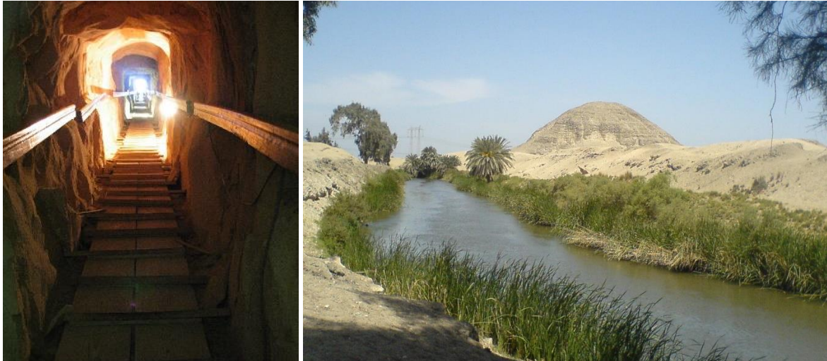
T. v. Ingång till pyramiden i Meidum. T. h. Pyramiden i Hawara.

Luxor är ett av de klassiska resmålen i Egypten med Luxortemplet och Karnak, båda knutna till guden Amon, och Konungarnas dal där Nya rikets härskare begravdes i dekorerade klippgravar. Vid vårt besök kommer vi att besöka dessa klassiker, men även andra tempel och gravar. De senaste fynden från Luxor kungjordes nu i oktober 2019: 30 färggranna, välbevarade kistor i trä. De tros ha tillhört religiösa ledare och deras familjer. Kistorna ska restaureras innan de visas upp på Egyptiska museet. Om vi har tur har The Lost Golden City i Luxor öppnat för besökare, men i skrivande stund pågår fortfarande arbetet att gräva ut staden.