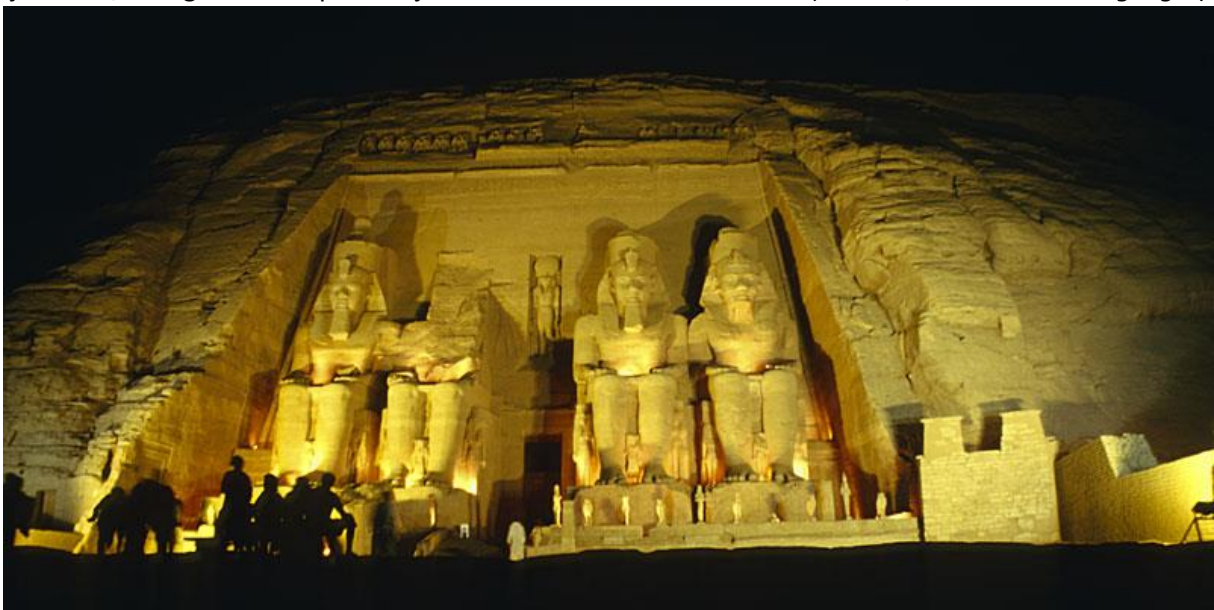
Ljus och ljudshow i Abu Simbel

Lunch ombord medan vi kryssar vidare till Abu Simbel, som kanske blir en av resans absoluta höjdpunkter. Unesco världsarvet, klipptemplen i Abu Simbel, räddades undan Nilens vattenmassor och flyttades till en högre plats. Ett komplicerat och kostsamt arbete som tog flera år att genomföra. När templet byggdes upp igen togs hänsyn till templens tidigare placering i förhållande till varandra och till solen. Det stora templet är konstruerat så, att solen två gånger varje år lyser hela vägen in i templet och belyser det innersta rummets bakre vägg där statyerna av fyra gudar finns. Templen är tillägnade Ramses II och hans gudomliga fader, solguden Ra, och hans huvudhustru Nefertari, i sin tur kopplad till moder gudinnan Hathor. När mörkret fallit får vi ta del av den fascinerande ljus- och ljudshow, som ges vid templen varje kväll. (Frukost, lunch och middag ingår)