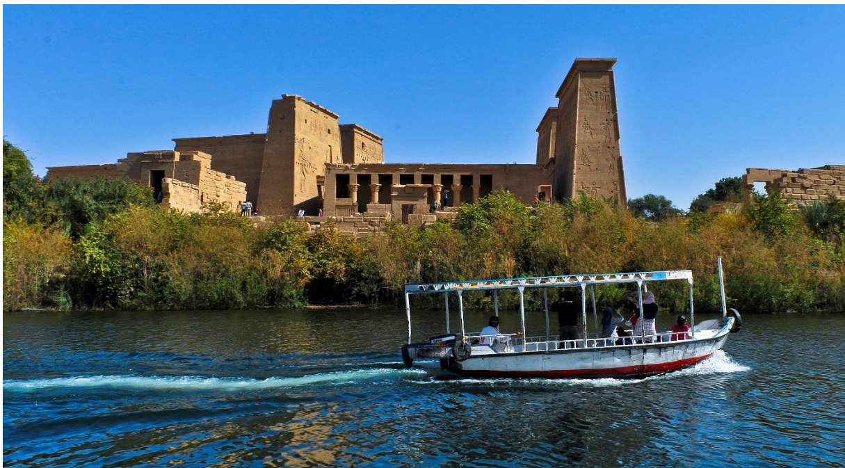
Philaetemplet i Assuan