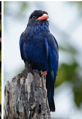
Unika arter som vi hoppas få se på Kryddöarna är (uppifrån och ned) Papuanäshornsfågel (Blyth's Hornbill), Gråhuvad fruktduva (Grey-headed Fruit Dove), Halmaherajueltrast (Ivory-breasted Pitta), Moluckdvärguv (Moluccan Scops Owl), Halmaherablåkråka (Azure Dollarbird).