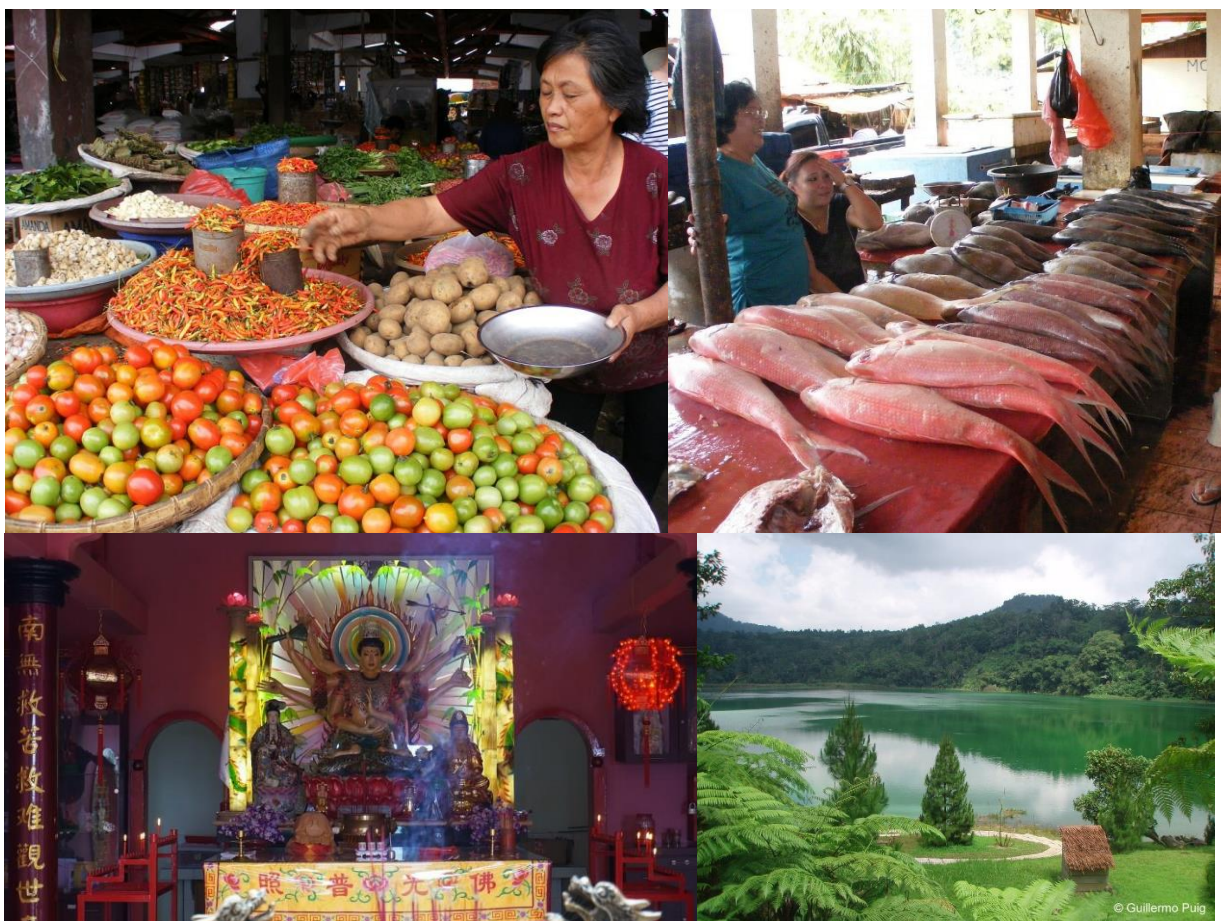
Översta raden: Vi besöker marknaden i Tomohon – här säljs allt som byborna kan behöva och den känsliga bör undvika köttavdelningen! Nedersta raden: I ett buddhisttempel. Den vackra Linowsjön.

Vi gör en heldagsutflykt i området. Vi åker upp mot Mahawu-vulkanen och går den sista biten upp för att i klart väder få milsvida vyer. I den lilla staden Tomohon väntar mat- och blomstermarknaden. I köttsektionen bjuds traktens delikatesser–nöt, fläsk, kyckling, orm, fladdermöss, hund med mera. Den som är känslig bör hålla sig till grönsaksdiskarna, de färggranna blomsterförsäljarna, fiskständerna och husgerådsavdelningen. Här säljs allt man kan behöva! Minahasan är också känt för sina smarta hus som lätt monteras ner och upp. Vid Tondanosjön äter vi lunch. Fisk är specialiteten serverad med färsk vattenspenat och den som gillar hetta tar in lite dabu dabu, det vill säga chilli, tomater och