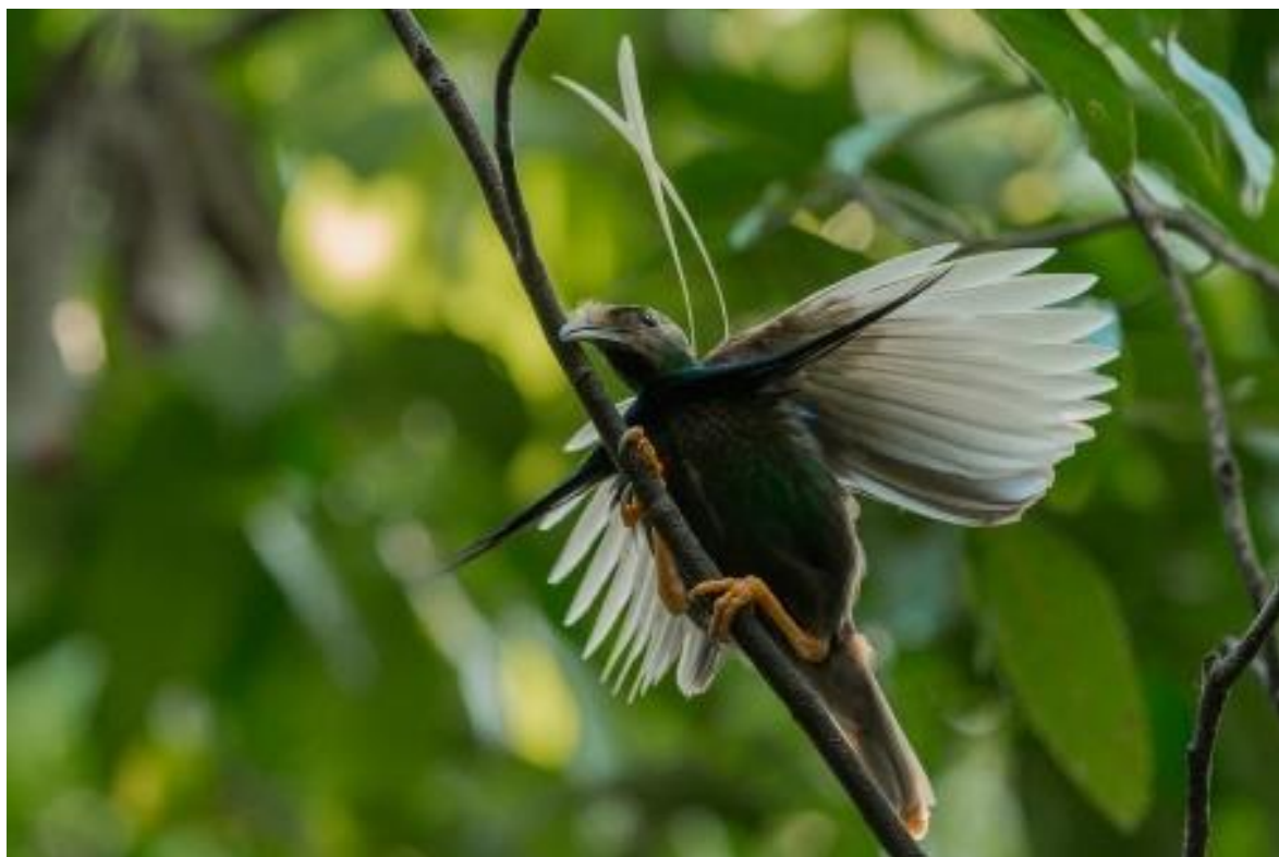
På Halmahera spanar vi efter den vimpelvingade paradisfågeln (Standardwing).