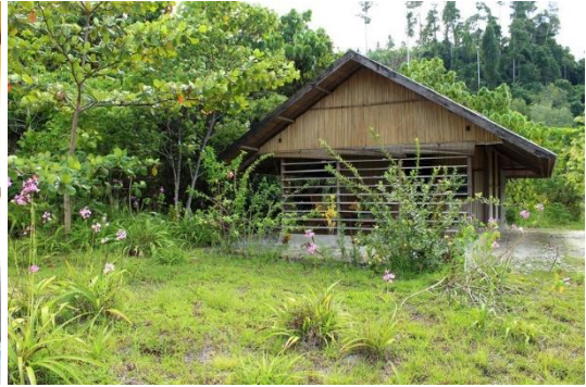
Vi bor bekvämt på den fina ekolodgen Weda Resort.