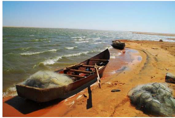
Fiskebåt vid sjön nära 4:e kataraken.