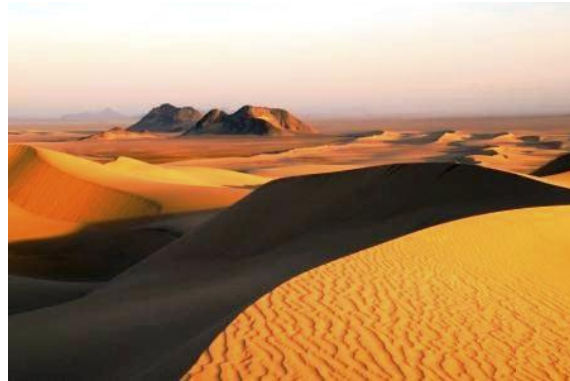
Vår färd bjuder på vidunderliga vyer.