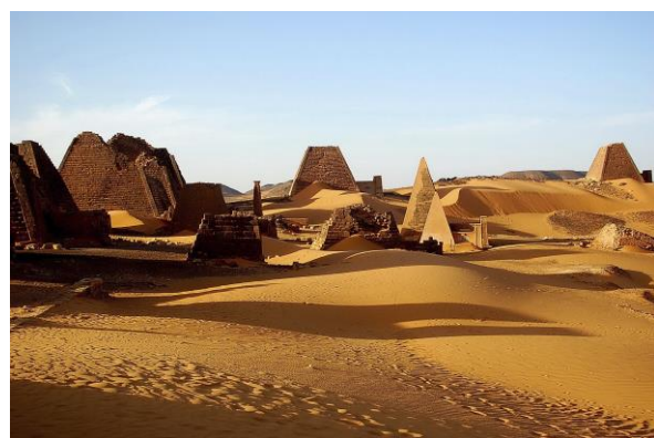
Vid Meroe, ett av UNESCO:s världsarv.