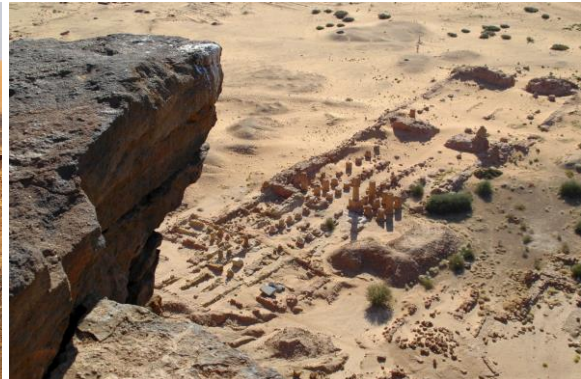
Vy över Amontemplet, Jebel Barkal.