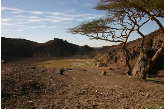
Atrun-kratern där nomader samlas för att utvinna salt.